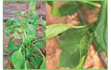
Sarı Çayakarı / Samanakarı ( Polyphagotarsonemus latus )