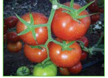
Domateste Beyaz Sinek