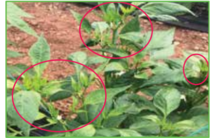
REQUIEM ile ilaçlandıktan sonra