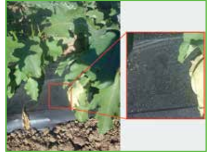
Patlıcanda Beyaz Sinek